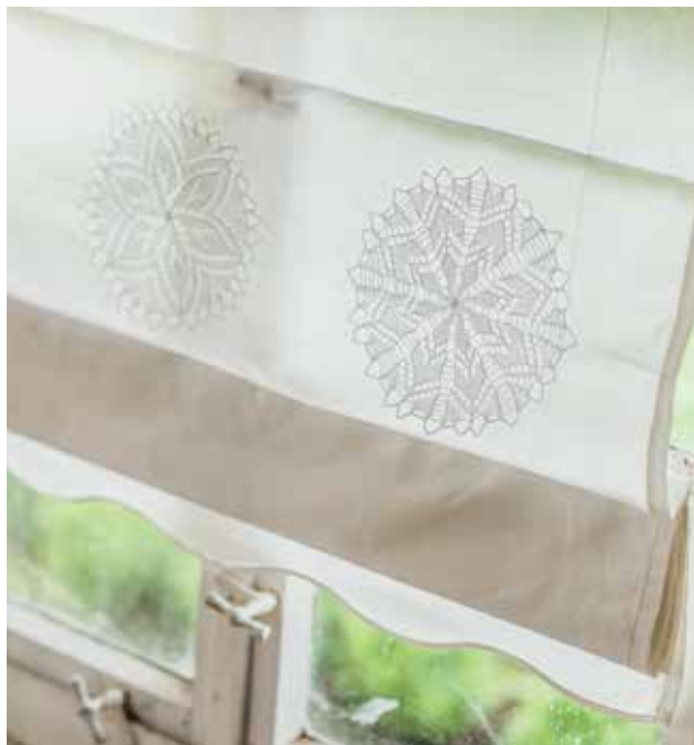
Von Licht durchleuchtet kommen die zarten Spitzendeckchen neu zur Geltung.